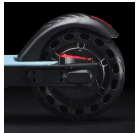
Motore posteriore da 250W