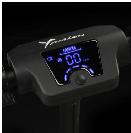
Display LED integrato